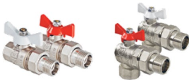
КРАНЫ ЛАТУННЫЕ ШАРОВЫЕ ПОЛНОПРОХОДНЫЕ С ПОЛУСГОНОМ СЕРИИ «BASE»